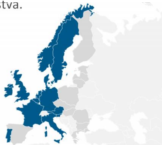
■ McKesson Europe

McKesson Europe je vodilna mednarodna družba za veleprodajo zdravil in zagotavljanje servisnih ter logističnih storitev na področju farmacije in zdravstva.